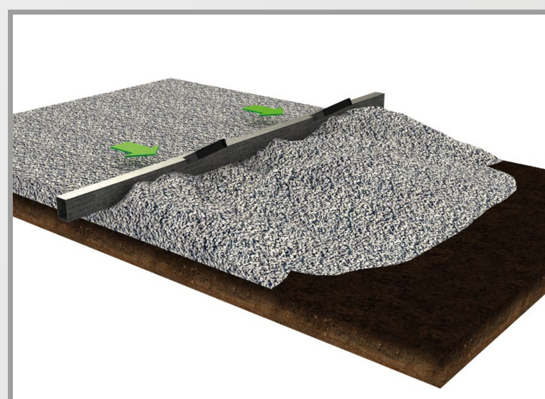
1) Stesura strato drenante in ghiaia