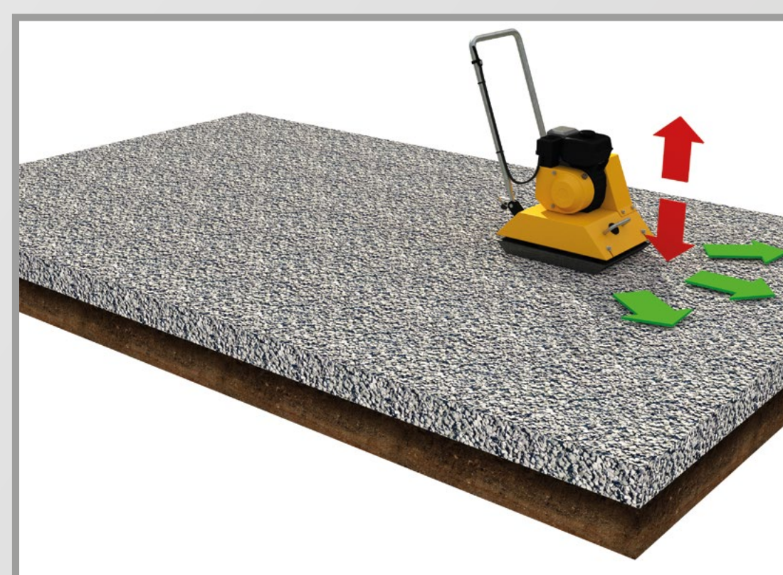
2) Compattazione strato di fondo