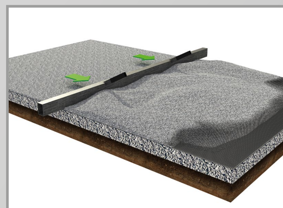
4) Intaso con ghiaia