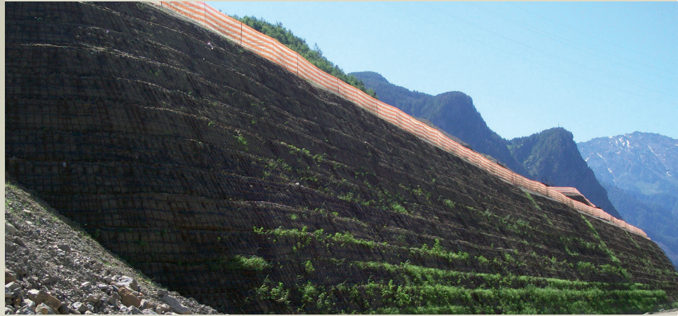
La facciata durante il rinverdimento