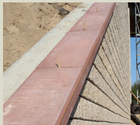
Dettaglio scossalina di finitura