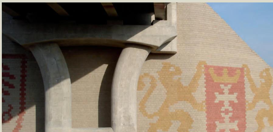
Dettaglio spalla di ponte