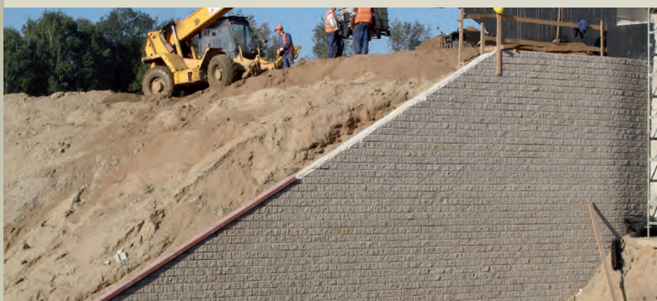
Le spalle durante la realizzazione