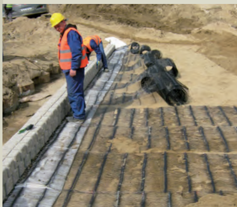
Geogriglie e blocchetti durante la posa