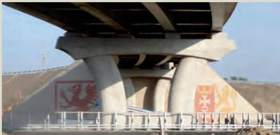
Spalle di ponte decorate

I muri hanno una curvatura uniforme e presentano motivi decorativi realizzati con blocchi appositamente colorati.