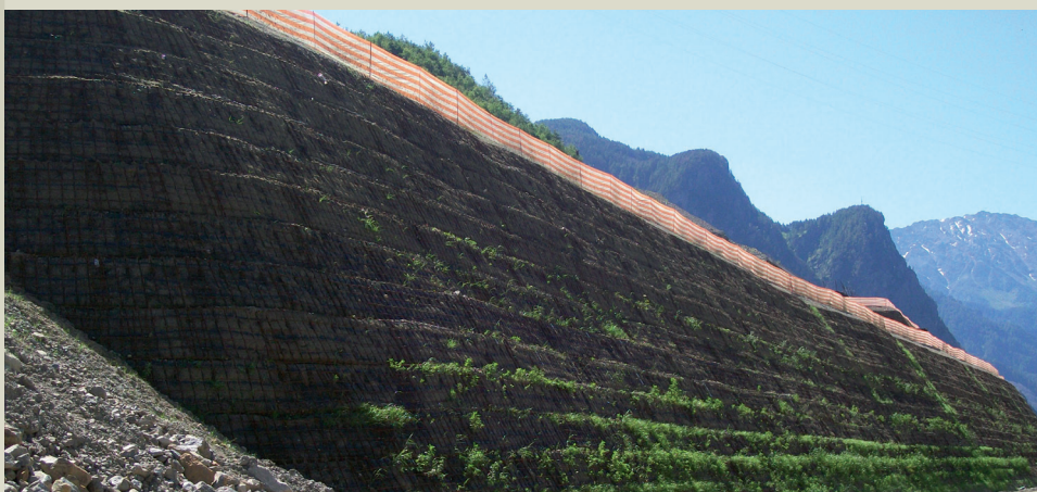
La facciata durante il rinverdimento