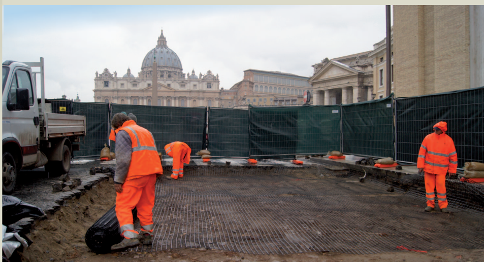
Operazioni di posa