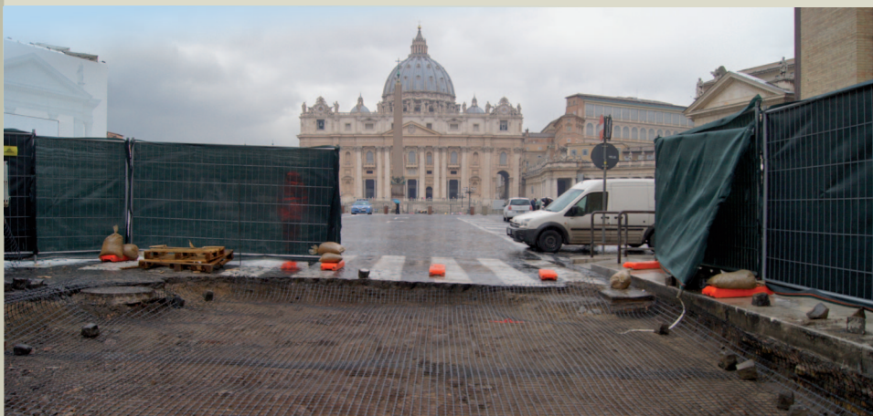
Area dell'intervento dopo la posa