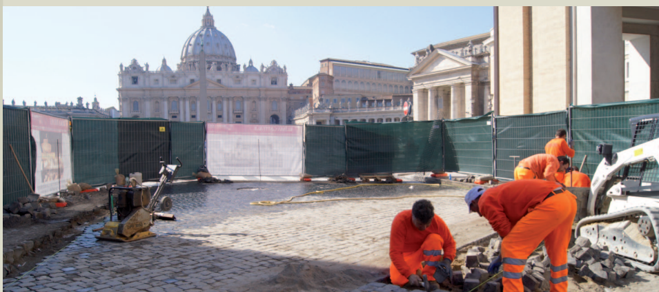
Posa della pavimentazione superiore