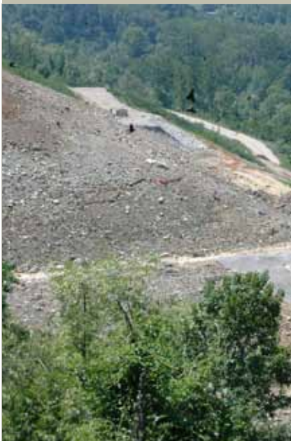
La discarica prima della chiusura definitiva

Il geocomposito filtro/drenante TENAX TENDRAIN 750/2 è stato scelto tra altri prodotti in quanto in grado di garantire, alle condizioni di progetto, una portata idraulica di 8.00 \cdot 10^{-4} \text{ m}^3/\text{sec}/\text{m} (0,8 Litri/m*sec.) ottemperando al Dlgs n. 36/03.