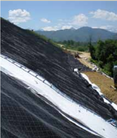
Posa ed ancoraggio delle geostuoie TENAX MULTIMAT R