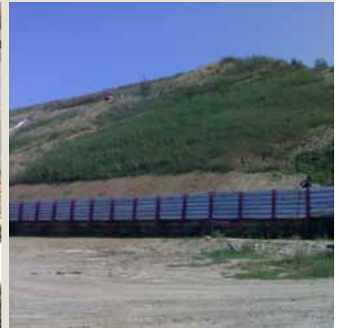
Inerbimento della discarica

TENAX TENDRAIN 750/2 E TENAX MULTIMAT 200 R HANNO OTTENUTO LA CERTIFICAZIONE CE 0799-CPD-25 RILASCIATA DALL'ENTE NOTIFICATO TEDESCO TBU RICONOSCIUTO A LIVELLO EUROPEO.