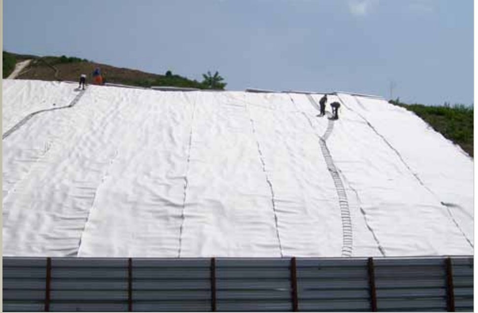
Posa in opera del geocomposito filtro-drenante TENAX TENDRAIN