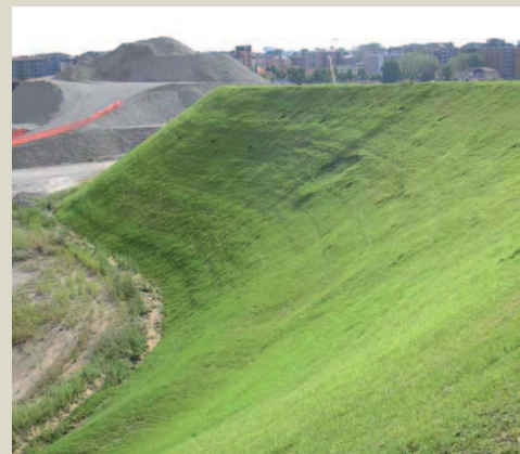
Pendio con TENAX Multimat dopo il rinverdimento