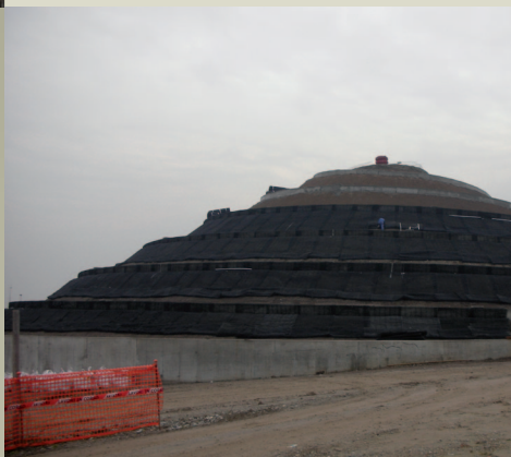
Collina a spirale durante i lavori