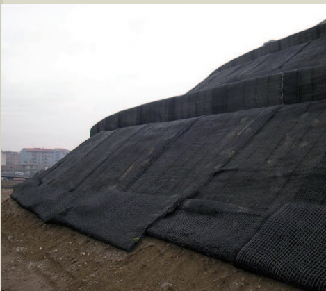
Operazioni di posa di TENAX Multimat