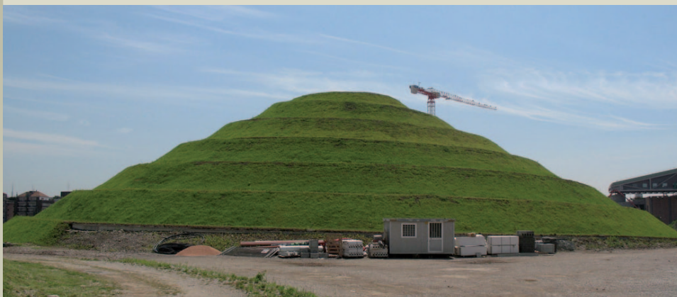
Collina a spirale dopo il rinverdimento