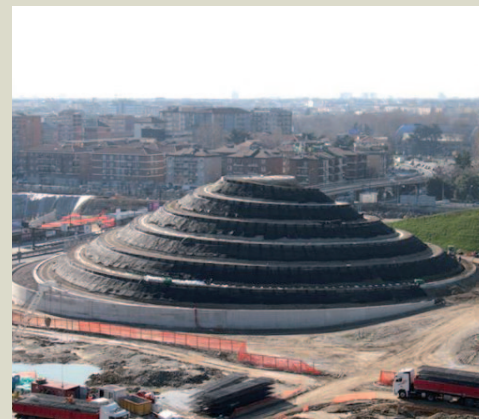
Collina a spirale dopo la fine lavori