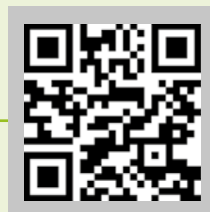
PRATI SINTETICI Video tutorial