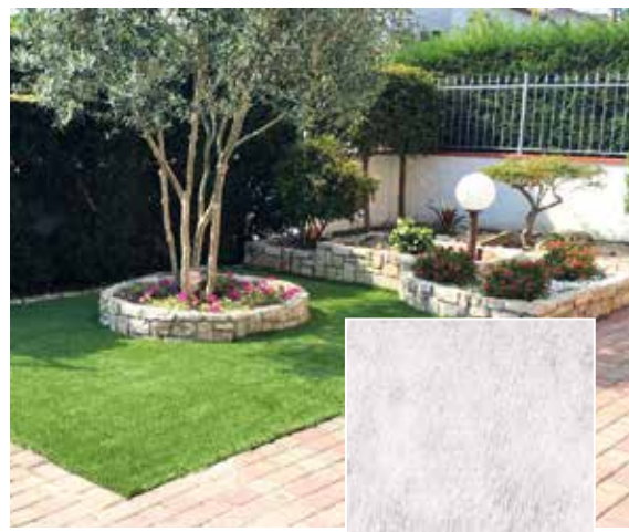
140 g/m 2