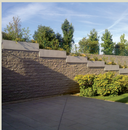
Muro di sostegno rampa