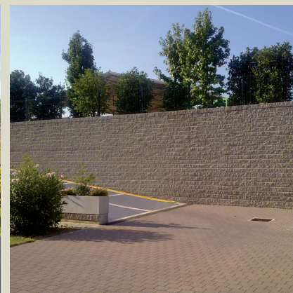
Muro di sostegno terreno a confine proprietà