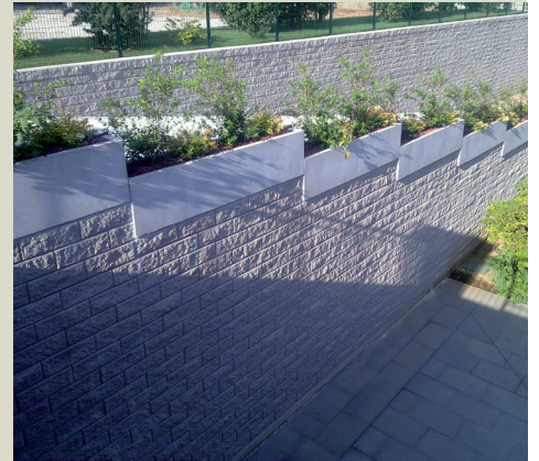
Dettaglio muro rampa