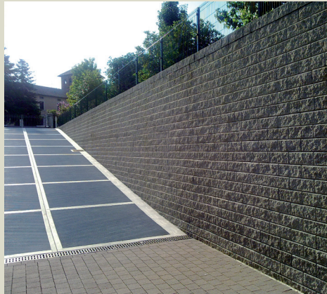
Raccordo con rampa di accesso