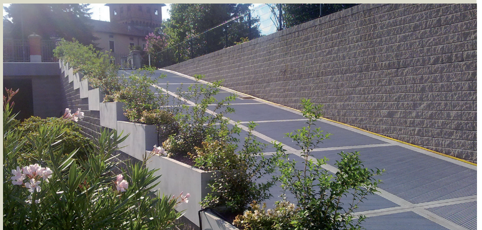
Dettagli muro rampa con fioriere