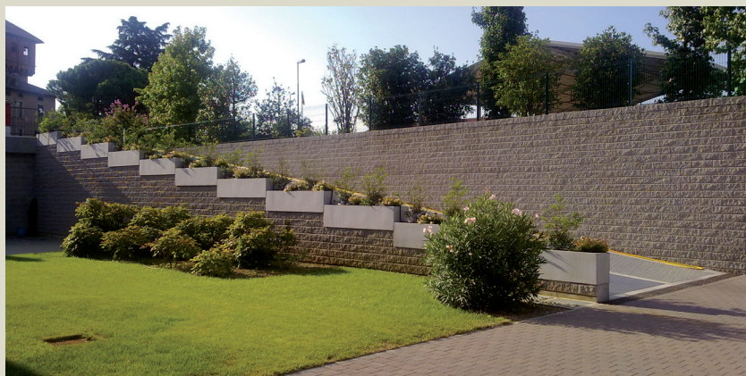
Panoramiche dei muri

Il muro è alto 3,00 m ed è raccordato al pendio esistente grazie a 2 curve arrotondate per permettere un migliore inserimento nell'ambiente