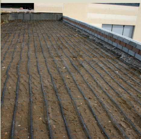
Le geogriglie di rinforzo