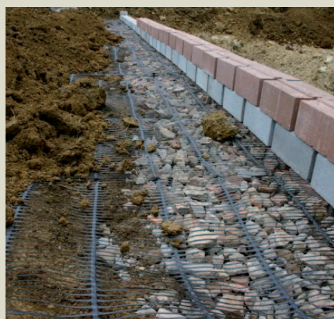
Dettaglio geogriglie, blocco, strato drenante e terreno di riempimento