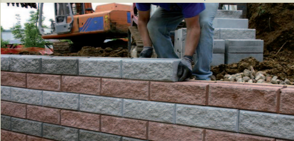
Operazione di posa dei blocchi