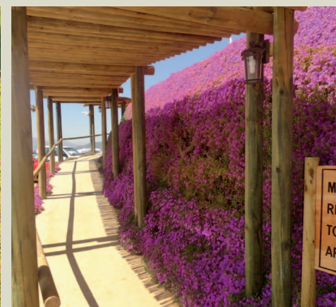
Rampa di accesso pedonale durante il rinverdimento e la fioritura