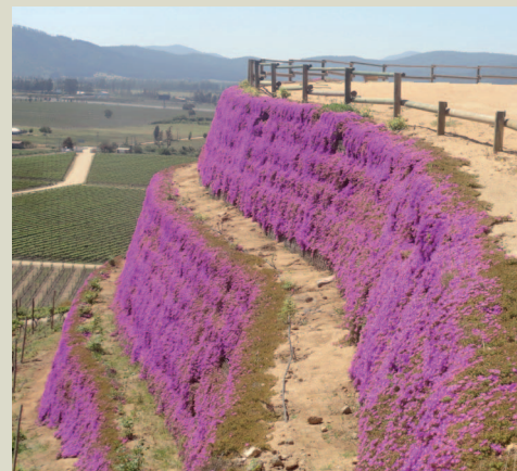
Facciata durante il rinverdimento e la fioritura