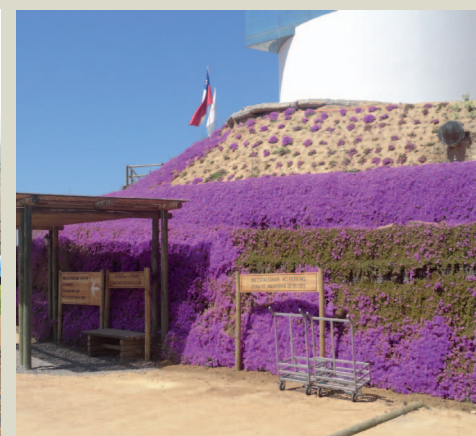
Rampa di accesso pedonale rinverdità e fiorita